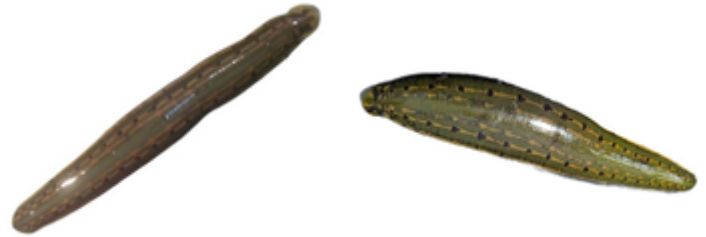
شکل ۳: زالوهای شرقی درمان شده Figure 3: Treated eastern leeches