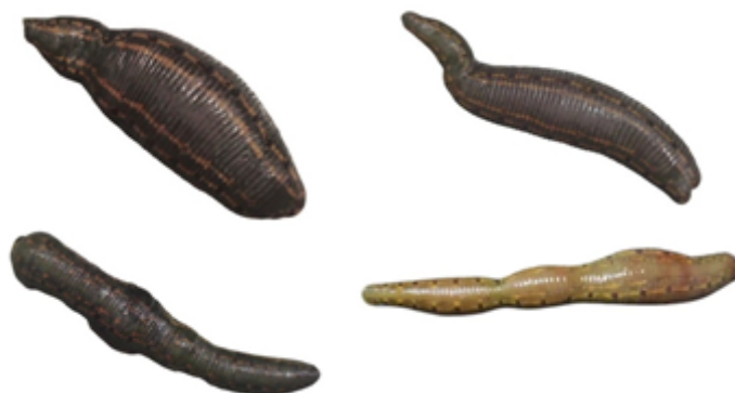
شکل ۲: تصویر زالوهای شرقی با بدن بندی شده

شامل: دما، نور و کیفیت آب ثابت نگه داشته شد تا تأثیر عوامل محیطی بر رفتار زالوها به حداقل برسد (۳۳، ۱۹). علاوه بر آن، برای افزایش دقت، از تصویربرداری روزانه جهت مستندسازی روند تغییرات فیزیکی استفاده شد. تعدادی از زالوهای بندی شده در شکل ۲ نشان داده شده‌اند.