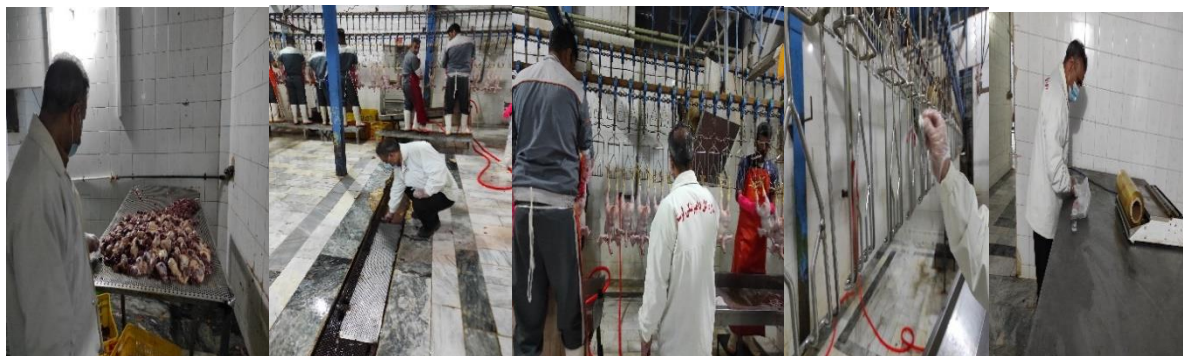
شکل ۱: محل‌های نمونه برداری از سطوح مختلف در کشتارگاه طیور استان لرستان

آزادزی، هفته‌ای یک بار تا سه مرحله، آمیب‌ها به محیط‌های کشت جدید پاساژ داده شدند. برای این منظور ابتدا در زیر میکروسکوپ نوری، ناحیه رشد آمیب روی پلیت با مژیک مشخص و سپس ناحیه مذکور را در کنار شعله و در زیر هود و در شرایط کاملاً استریل با