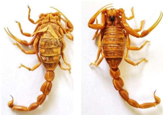
شکل ۳: نمای شکمی (سمت راست) و نمای پشتی (سمت چپ) در جنس ماده عقرب A. susanae جمع‌آوری شده از استان خوزستان

میانگین و انحراف معیار هر کدام از ویژگی‌های اندازه‌گیری شده بر حسب جنسیت گونه در جدول ۲ بیان شده است. در تمامی موارد میانگین اندازه‌های گونه ماده از گونه نر بیش‌تر بود و به جز صفات Cl، CHL، ML، TIW، MTIL، MTHLL، MTIVL، MTIIW، MTIVW، MTIH سایر ویژگی‌های مورد بررسی در دو گونه نر و ماده یکسان بودند (P>۰/۰۵). تفاوت در نمای پشتی و شکمی عقرب A. susanae در دو جنس نر و ماده در شکل ۲ و ۳ نشان داده شده است.