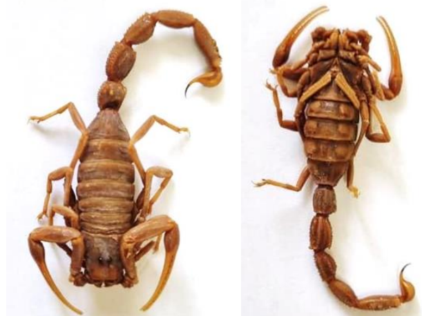
شکل ۲: نمای شکمی (سمت راست) و نمای پشتی (سمت چپ) در جنس نر عقرب A. susanae جمع‌آوری شده از استان خوزستان